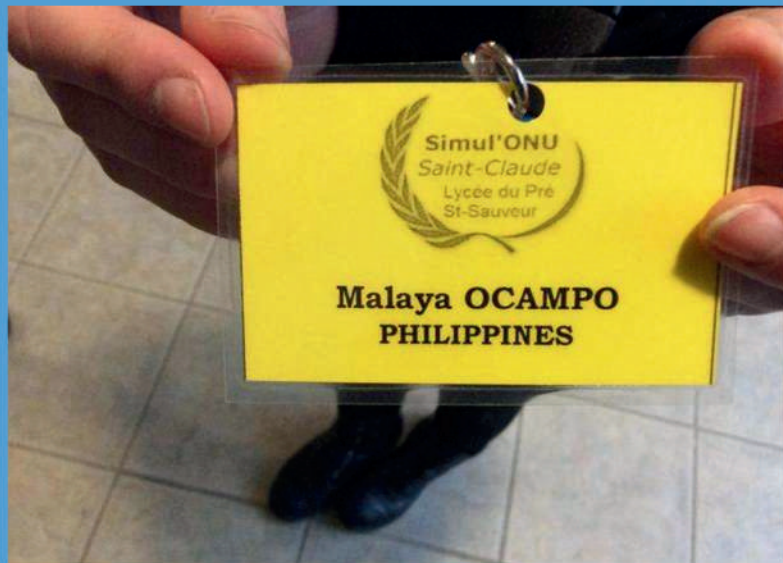
Chaque apprenti diplomate prend un pseudonyme