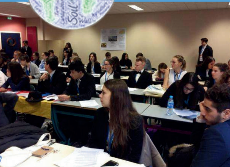
Le travail en comité, lycée du Pré Saint Sauveur